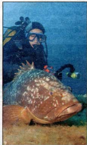
Le mérou revient sur nos côtes.