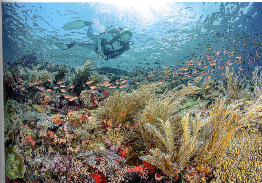
Avril 2022, Komodo National Park, à 15 m de profondeur : « On se croirait dans un champ de blé, et pourtant ce n'est que du corail de feu, très vibrant et qui abrite encore une faune diverse et variée, caractéristique de notre environnement marin dans l'océan Indien ».