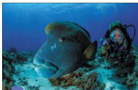
3 Ce poisson, qu'on croirait coiffé d'un bicorne, porte le nom bien trouvé de « Poisson Napoléon » pour qualifier la bosse sur sa tête. C'est un des plus insolites personnages de l'exposition.