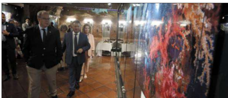
4 Sensible depuis longtemps au travail d'Olivier Jude et de Sylvie Laurent, le prince Albert II a visité vendredi soir l'exposition, qui est gratuite et ouverte à tous dans la galerie des Pêcheurs jusqu'au 31 août.