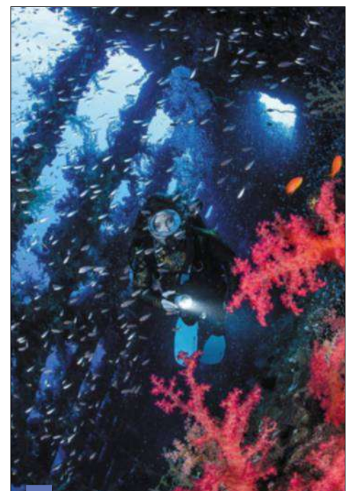
5 Dans l'épave du Giannis D, véritable Disneyland pour les amateurs de plongée en mer Rouge, les restes de l'embarcation ont été colonisés par les coraux, montrant que la vie a repris ses droits.